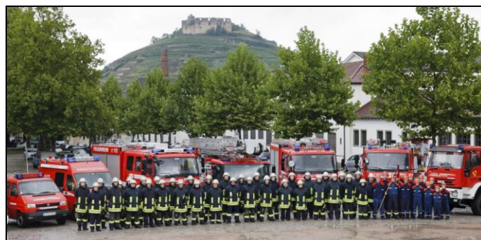
Die Staufener Feuerwehr

Lieber Herr Philipp, vielen Dank für dieses Gespräch. Wir werden heute im Fürbittengebet auch für die Arbeit von euch Feuerwehrleuten beten. Und ich denke, wir dürfen Ihnen und Ihren Kameraden heute auch mal ganz herzlich danken für diesen wichtigen Dienst. Man ist zwar froh, wenn man die Feuerwehr nicht braucht, aber wenn's brennt, ist man heilfroh, wenn sie möglichst schnell zur Stelle ist. Vielen, vielen Dank dafür!