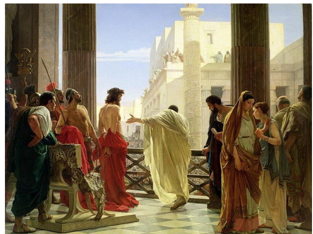
Antonio Ciseri, Ecce Homo, ca. 1868-80

18 Da schrien sie alle miteinander: „Hinweg mit diesem, gib uns Barabbas los!“ 19 Der war wegen eines Aufruhrs, der in der Stadt geschehen war, und wegen eines Mordes ins Gefängnis geworfen worden. 20 Da redete Pilatus abermals auf sie ein, weil er Jesus losgeben wollte. 21 Sie riefen aber: „Kreuzige, kreuzige ihn!“ 22 Er aber sprach zum dritten Mal zu ihnen: „Was hat denn dieser Böses getan? Ich habe nichts an ihm gefunden, was den Tod verdient; darum will ich ihn schlagen lassen und losgeben.“ 23 Aber sie setzten ihm zu mit großem Geschrei und forderten, dass er gekreuzigt würde. Und ihr Geschrei nahm überhand. 24 Und Pilatus urteilte, dass ihre Bitte erfüllt werde, 25 und ließ den los, der wegen Aufruhr und Mord ins Gefängnis geworfen war, um welchen sie baten; aber Jesus übergab er ihrem Willen.